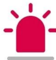
Intelligent Alarm Status